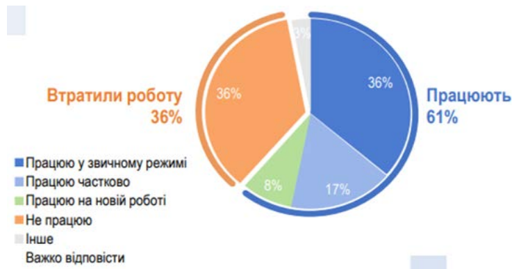
Рис. 1. Трудова зайнятість українців станом на липень 2022 року

Окрім того, за даними комплексного порівняльного дослідження «Як війна змінила мене та країну. Підсумки року», яке проводила соціологічна група «Рейтинг», бачимо, що 36% осіб втратили роботу, 17% респондентів працюють частково, 8% опитаних працюють на новій роботі. На рисунку 1 вказана оцінка зайнятості населення під час війни. Як бачимо, 61% респондентів працюють, тоді як 36% – втратили роботу (рис.1).