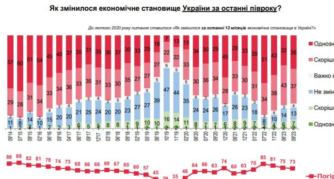
Рис. 3. Динаміка змін економічного становища України за останні півроку

Говорячи про економіку країни у майбутньому, 29% респондентів очікують покращення, 26% осіб вважають, що нічого не зміниться, а 32% опитаних прогнозують погіршення. Щодо особистої ситуації, то 23% осіб сподіваються на покращення свого фінансового становища в найближчий рік, 41% респондентів вважають, що воно залишиться без змін, і 21% опитаних висловлюють песимістичні переконання. (Двадцять четверте загальнонаціональне опитування «Україна в умовах війни. Настрої та економічне становище населення». 2023).